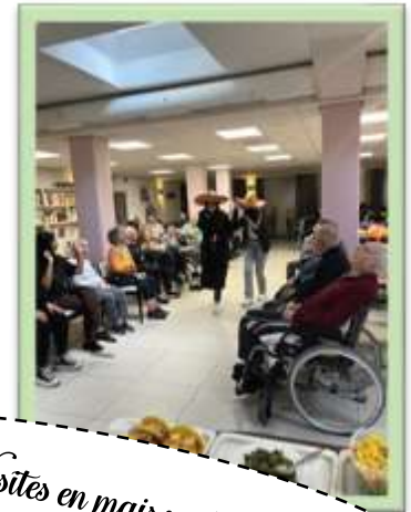
Visites en maison de repos