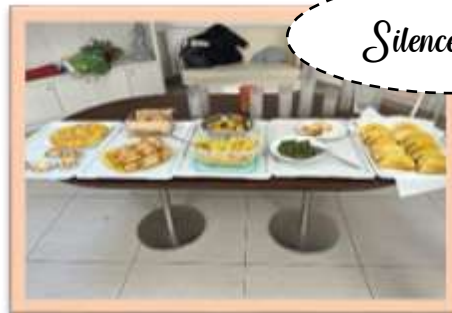
Silence on lit !