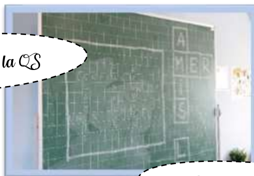
Réalisation d'une fresque